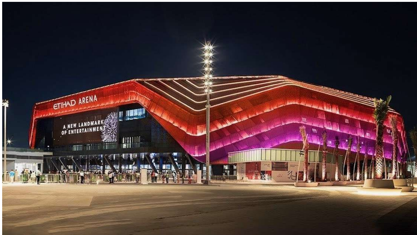
21st Century Orchestra | Etihad Arena, Abu Dhabi