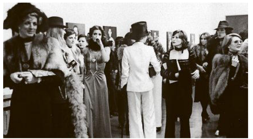
Die Vernissage «Transformer» im Jahre 1974.

Luzern Die Kunstgesellschaft Luzern wurde im Jahr 1819 von Künstler/-innen und Bildungsbürgern gegründet, die ein visuelles Archiv schaffen und der Öffentlichkeit zugänglich machen wollten. Paul Hilber, von 1924 bis 1926 Präsident der Kunstgesellschaft und von 1925 bis 1949 Konservator des Kunstmuseums Luzern, machte die Institution durch Ausstellungen zu bedeutenden Schweizer Künstlerinnen und Künstler wie Robert Zünd, Giovanni Giacometti und Paul Klee über die Zentralschweiz hinaus be-